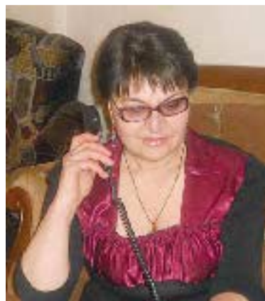
სამართლით გათვალისწინებული წესით.

4. თუ უცხო ქვეყნის დიპლომატიურმა წარმომადგენელმა, აგრეთვე სხვა პირმა, რომლებიც დიპლომატიური იმუნიტეტით სარგებლობენ, დანაშაული საქართველოს ტერიტორიაზე ჩადინეს, მათი სისხლის-სამართლებრივი პასუხისმგებლობის საკითხი გადაწყდება საერთაშორისო