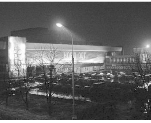
Группа вооруженных людей захватила в среду вечером заложников в Центральном центре «На Дубровке» (бывший Дом культуры КПЗ-1) в Москве.