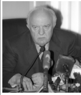
Президент Грузии выразил свое отношение к создавшейся в Москве обстановке и после состоявшейся 24 октября торжественной церемонии вручения государственных наград отметил: «Распространялись слухи будто из захваченных заложников освободили грузин и абхазов, что не соответствует действительности. И сейчас среди удерживаемых в аемых двое грузин, в том числе девушка. Мы дали пристанище чеченцам тогда, когда им было очень трудно. По сей день в Грузии находятся 4-5 тысяч чеченских беженцев, которые пользуются равными с гражданами Грузии правами. Поэтому у нас есть моральное право обратиться к чеченцам с просьбой, если угодно, требовать от них отказа от этого замысла. Возможно, у нас были с Россией определенные спорные

вопросы, но мы хотим лишь добра России. Хотим, чтобы соседняя с нами большая страна была стабильной. Это во многом будет способствовать и стабильности Грузии. Россия, со своей стороны, кровно заинтересована в стабильности Грузии. Это неоднократно говорил мне Президент Путин.