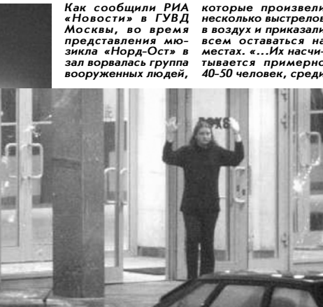
Продолжение темы на 2-й, 3-й и 4-й стр.

Как сообщили РИА «Новости» в ГУВД Москвы, во время представления мюзикла «Норд-Ост» в зал ворвалась группа вооруженных людей, некоторые из террористов — в масках, — такими данными официальный представитель ГУВД Москвы определил численность террористической группы.