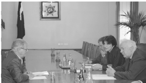
«Совет Европы испытывает те же проблемы, которые приходится преодолевать Грузии, в том числе, особенно нерешенный конфликт в Абхазии и напряженные отношения с Россией», - заявил Клаус Шуман и отметил, что Совет Европы делает всё для того,

Совет Европы поддерживает Грузию в осуществлении реформ и намерен усилить эту поддержку и в финансовом отношении при помощи Еврокомиссии. На состоявшейся десятого октября встрече с Президентом Грузии Эдуардом Шеварднадзе директор Директората по политическим вопросам Совета Европы Клаус Шуман заявил, что через несколько дней будет оформлен совместный проект Совета Европы и Еврокомиссии, предусматривающий оказание Грузии помощи в осуществлении реформ. Аналогичный проект, разработанный полностью в поддержку государств Южного Кавказа, уже существует. В новом же проекте объектом внимания Совета Европы будет только Грузия.