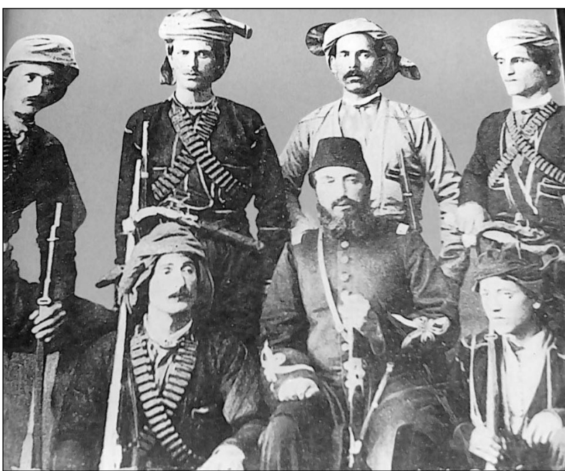
ჯანყებ და გურიას შეერთებით.

მაქსიმეს შემდეგ ფაშობდა მისი შვილი მეტეფ ფაშა, რომლის შვილებიც: ალი ფაშამ, ოსმან ფაშამ, ხუსეინ ბეგმა. ხასან ბეგმა საკმაოდ გაითქვა სახელი. რუსეთ-ოსმალის ადმოსავლურ ომებში მეზობელი-ოზურგეთის ქვეყანის მკვიდრთა დავიწროებაში გადმოგვეცქერ: ხასან ფაშას უმცროსი ძმა-ალი ფაშა თავდგირითი, რომელსაც არა ერთი და ორი მრუდე საქმე ჰქონდა ნაკეთები მანამდე რუსის ხელისუფლებისა და მონათესავე გურულების წინააღმდეგ. 1848 წელს გადმოვიდა გურაში, მივიდა გრივოდ და ლეგან გურიელებთან და მთვე განუცხადა: თუ რუსები ჩემს მამულებს, რომლებიც ოსმალეთის მთავრობამ წამართვა, დამიბრუნებენ, და ჰქნისასაც დამინიშნავენ, ქობულეთის სალხს ავა-