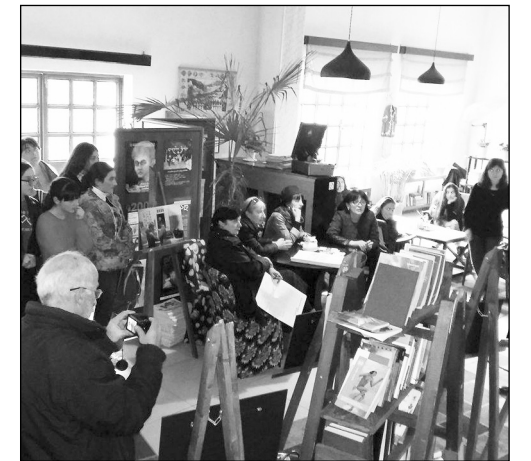
შესახებ. საუბარი შეეხო შშობლის და სკოლის როლის მოზარდის აღზრდის საკითხში.

მნიშვნელოვანია, რომ დამსწრე აუდიტორია საკმაოდ აქტიურად ჩაერთო პრობლემის ირგვლივ გამართულ დისკუსიაში, გამოითქვა შეხედულებები საქართველოში ადრეული ქორწინების მიზეზების