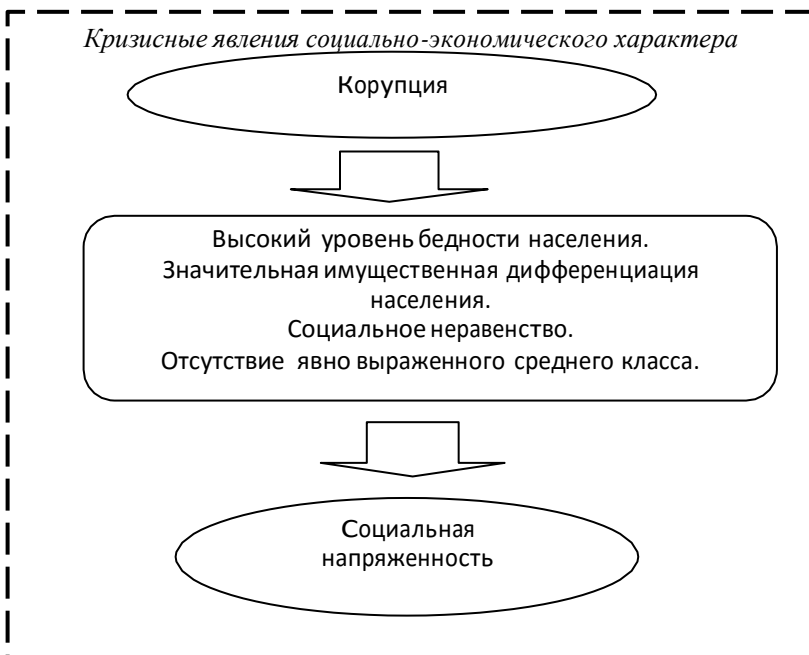
Рисунок 1 – Взаимосвязь кризисных явлений социально-экономического характера

К рассмотренным выше основным кризисным явлениям социально-экономического характера необходимо добавить еще два – коррупцию и социальную напряженность. На рисунке 1 приведена взаимосвязь кризисных явлений социально-экономического характера.