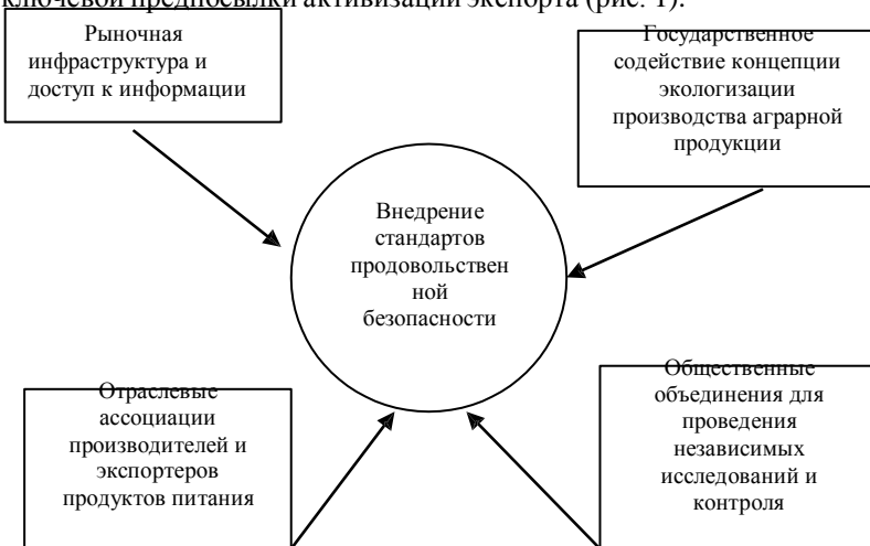
Рис. 1. Факторы внедрения системы продовольственной безопасности

По органической продукции распространенной практикой является сотрудничество с зарубежными органами по сертификации стран целевого импорта, поскольку потребители страны-импортера в большей степени склонны доверять органическим продуктам, маркированным национальным органом сертификации. Рассмотрим ряд факторов, которые обеспечивают предпосылки для успешного внедрения стандартов качества и безопасности продовольствия как ключевой предпосылки активизации экспорта (рис. 1).