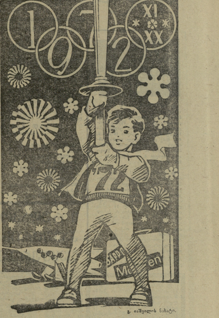
გ. იაშვილის ნახატი.

ეს საკითხი მალე გაირკვევა. არის რამდენიმე კანდიდატურა. სკუნდანტი კი, როგორც იცით, თბილისში ასლაგანწრდა ოსტატი თამაშ გიორგაძე იქნება.