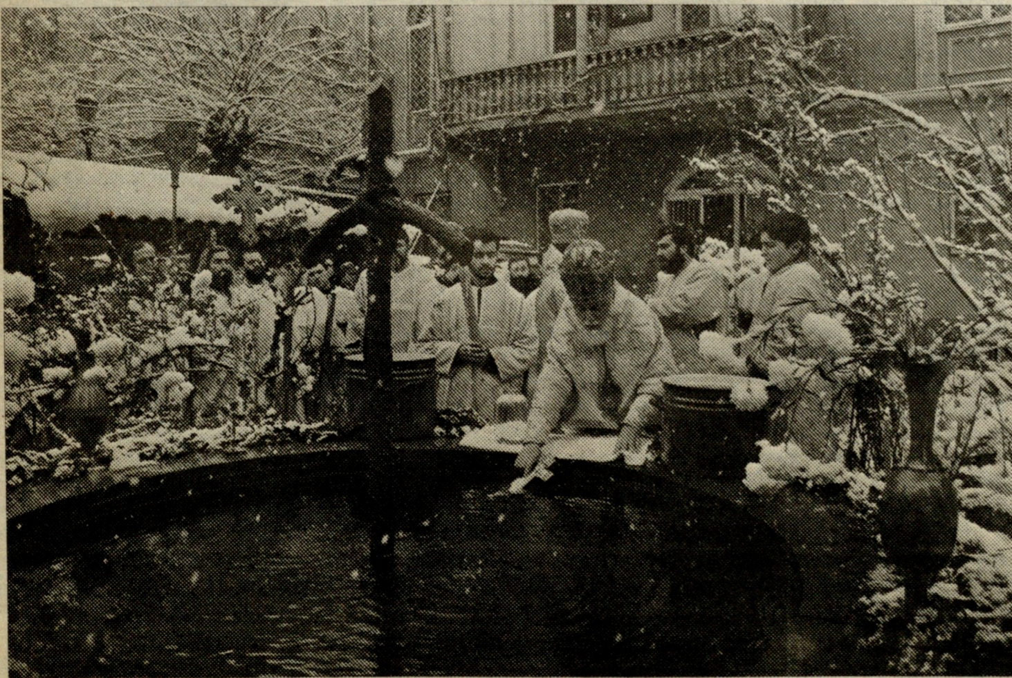
ნე და ერთ თამა-