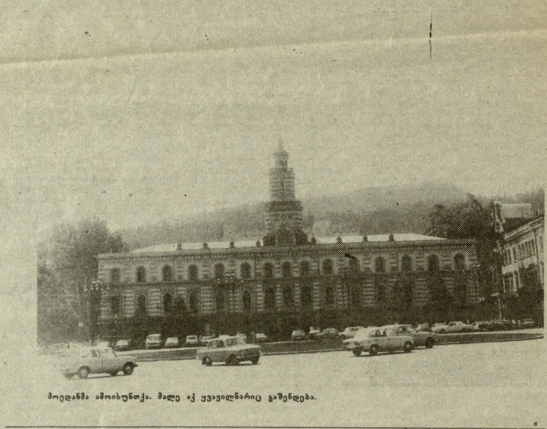
მოედანმა ამოიხუნტა. მალე აქ უკავილნარიც გაუნდება.

გამოვიდა არჩილ ჯორჯაძის საზოგადოების ლიტერატურულ-ისტორიული ეურნალის „ერთობის“ IV ნომერი, რომელიც თემატურად მეტად მრავალფეროვანი და საინტერესოა. ეურნალი იხსნება ცნობილი ქართველი ესეისტის გერონტი ქიქოძის წერილით „მელანქოლიური მენიშენები“, რაც ქართული ხასიათის კვლევის და ისტორიის მიმოხილვის ცდაა; აქვე რუბრიკით „საქართველო და მეფის რუსეთი, ქართველი პოეტი და ორთავიანი არწივი“ დაბეჭდილია ვანტანჯ ორბელიანის ლექსი „გამოსალმება“ და ნაწყვეტი გენერალ პეტრე კრასნოვის რომანიდან „ორთავიანი არწივიდან ვიდრე წითელ დროშამდე“.