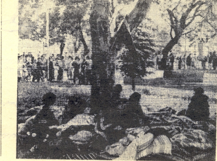
მორიგი საპროტესტო აქცია ქ. გორში