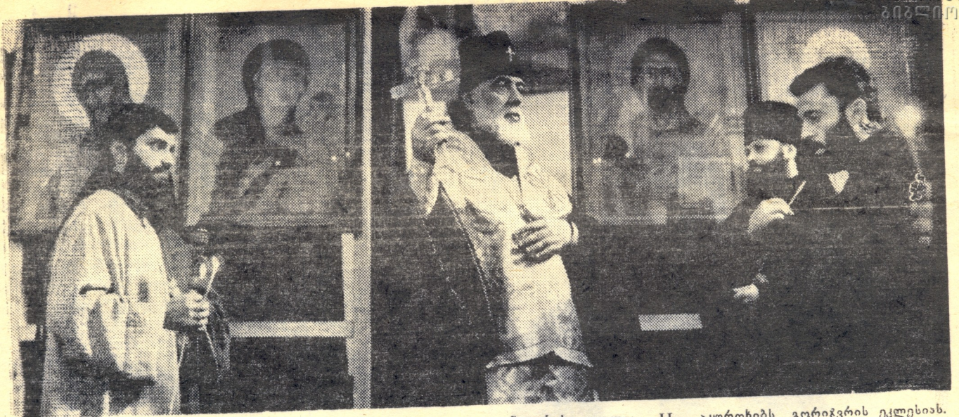
სრულიად საქართველოს კათალიკოს-პატრიარქი, უწმინდესი და უნეტარესი ილია II აკურთხებს გორიჭვრის ეკლესიას.