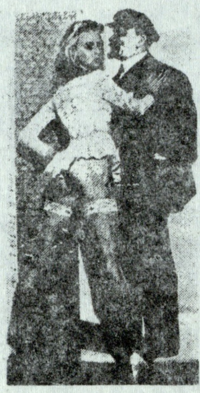
Время другое. И мы другие.

საქართველოში იმპერიის მე-5 კოლონიამ სკკპ-მ თვითლიკვიდაცია უნდა მოახდინოს. მისი აურაცხელი უძრავ-მოძრავი ქონება კი ხალხის მიერ აღიარებულ პარტიებს შორის განაწილებს.