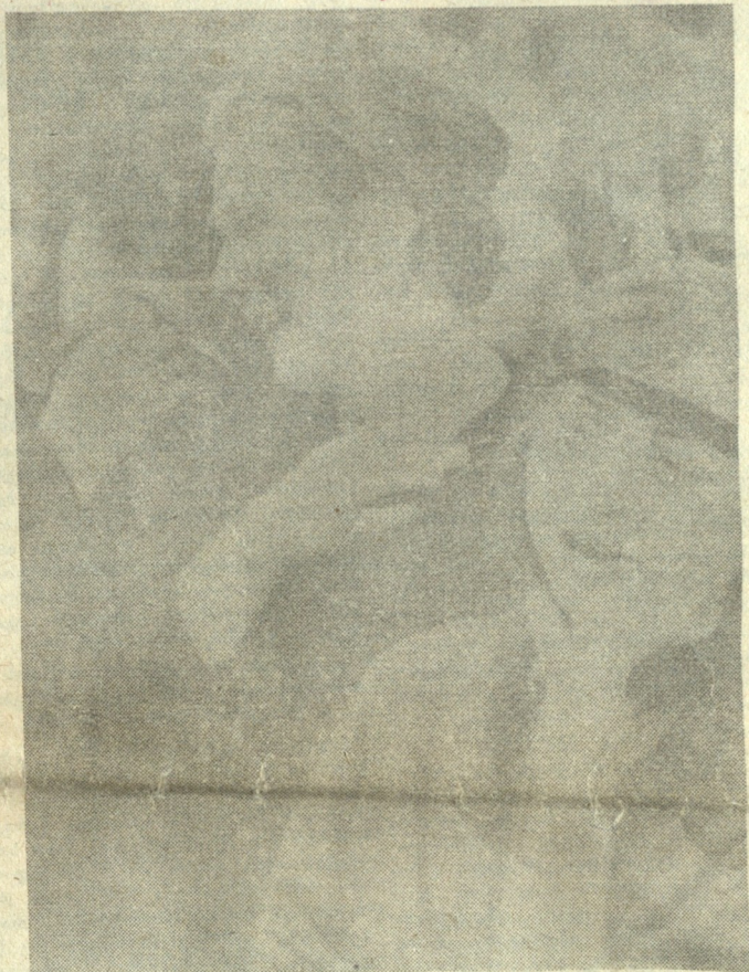
მაგრებით გასხვივოსნებული. იმ დღეს აპრილის თვეში დაცემულთა ნათელი სულებიც შემოგებხვევიან, მოგაფერებიან, გაგიყურებებიან, შენი თავისუფალი ზეცის დაჟვარდებში დაივანებენ. აი, იმ წუთებს შევნატრით, იმ ბედნიერი მომავლისათვის გვინდობარ, ჩვენო მრავალტანჯული მიწავ, ქართული!

მაგრამ შენი იქნება სულ სხვა დღეს, სხვა შუქითა და რწმენით გათენებული, სხვა აღ-