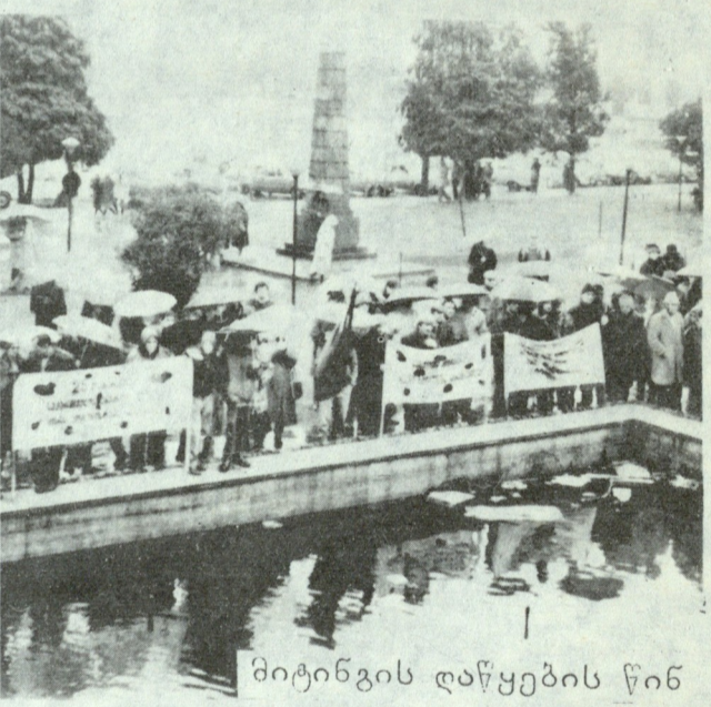
მიტინგის დაწყების წინ