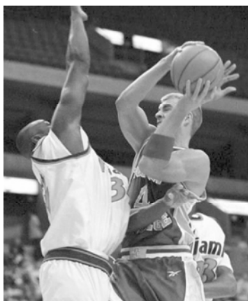
«Детройт Пистонс». В настоящее время принадлежит Югославии, которые завоевали его четыре года назад в Афинах.

назад в Афинах. Кстати, сборная США получила тогда лишь бронзовые медали (второе место досталось россиянам), так как была составлена из игроков студенческих команд. Звезды НБА не смогли принять участие в ЧМ-98, поскольку в тот момент вели спор об условиях коллективного соглашения с владельцами клубов и руководством ассоциации.