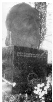
Стрaшная весть о веролюпном убийстве Ильи Чачавадзе потрясла всю Грузию. “Убили Илью!” — пронесся слух в четверг вечером 30 августа 1907 года и потряс весь Тифлис...

95 ЛЕТ ТОМУ НАЗАД ПРОИЗОШЛА ЦИЦАМУРСКАЯ ТРАГЕДИЯ