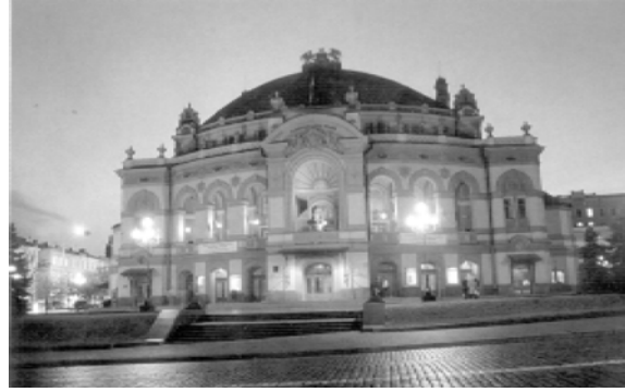
Посольство Украины в Грузии

В последние годы постоянно увеличивается товарооборот между Грузией и Украиной. Обозначились новые направления торгово-экономических отношений, наши рынки становятся все более открытыми для грузинских товаров и услуг. По прогнозам, товарооборот в этом году между Грузией и Украиной может быть наивысшим за последние 11 лет.