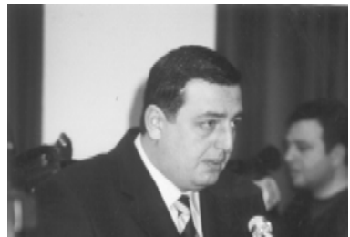
Сулхан МОЛЛАШВИЛИ, председатель Палаты контроля Грузии

продажи акций. Более того, акции были проданы со снижением цены на 30,8 тысячи долларов. Тревожно то, что эти газораспределительные предприятия после продажи контрольного пакета акций стали убыточными производствами.