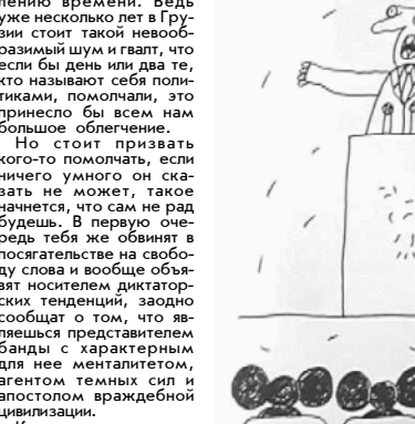
ораторы заставят прозреть электорат, научат его, в конце концов отделить зерна от плевел. А такое станет возможным, если мы наберемся терпения и предоставим все трибуны, микрофоны, телеэкраны субъектам, которые рвутся к власти.

своей и спокойно ответил: — К сожалению, должности заместителя заняты. — Снимите кого-либо из них и назначьте меня. Кто еще, кроме меня, получил образование в Америке?! На это министр ответил, что не собирается делать кадровые перестановки в ближайшее будущее. Обидевшись на это, ученый юрист с присущей ему сюрреалистичностью и желчью произнес свою первую тираду: — Я все-таки приду в большую политику и обязательно сниму вас с вашей должности! Пришел и... Именно на этом месте прервал свой рассказ тот осведомленный гражданин. Лично я считаю эту историю придуманной, но согласитесь, она очень реально передает атмосферу Саакашвили, хотя бы в той части, что в будущем он собирался снять министра. Да что там министр! Теперь он замкнулся на своего крестного отца в политике Эдуарда Шеварднадзе и во