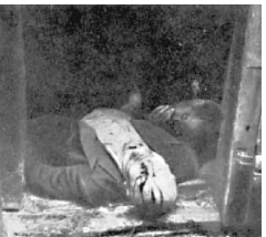
Гильотина была во Франции в XIX веке особенно популярным орудием казни. Для дерзкого учёного, пытавшегося в 1887 году переосмыслить отрубленные головы на со-