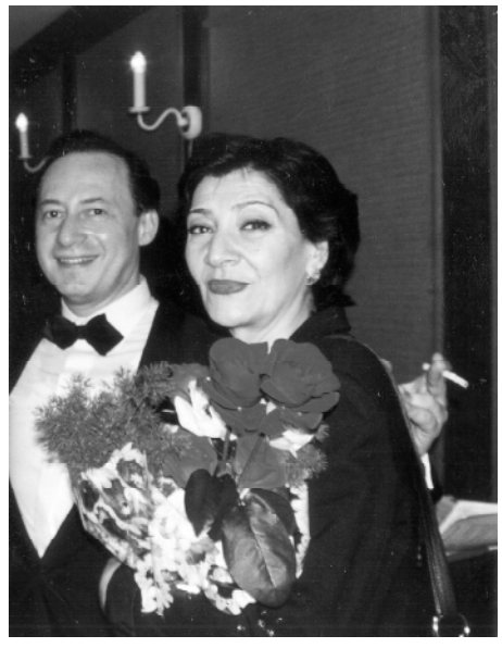
в городах Соединенных Штатов в том числе в Нью-Йорке, Чикаго, Бостоне.

— Хочу начать нашу беседу с комплиментов. Вы замечательно выглядите. Как вы считаете, что определяет долготелее внешней привлекательности? — Ни один человек не сможет это объяснить. Стараясь быть в форме, с давних пор занимаюсь физкультурой, дыхательной гимнастикой по йогоской системе. Обращаю большое внимание на прическу — лохматая никогда не выйдут на улицу. Если я не в форме, то вообще никому не покажусь на глаза, даже близкий подруге, живущей напротив. — Диету соблюдаете? — Я никогда не была на диете. Не переносю ограничений — все равно ничего не буду соблюдать. — Вы только что приехали из Москвы. Давали концерты? — В Москве у меня свой директор, меня приглашают, однако сольные концерты в больших залах очень редки. Артисты эстрады сегодня в основном выступают в клубах или казино. Но это совер-