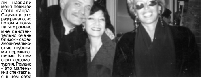
Он попросил, чтобы я его обняла. Так и сняли. У нас с Ельциными очень хорошие, близкие отношения.

но! Как можно это забыть? А само ничего не могла вспомнить о том эпизоде в Пищунде. Борис Николаевич захотелось сфотографироваться вместе со мной. — Только искусство может помочь этому делу, но