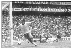
Тостао Гонсалвеш в составе сборной Бразилии.

Великий в прошлом бразильский нападающий Тостао крайне негативно высказывается об общем уровне футбола на нынешнем чемпионате мира.