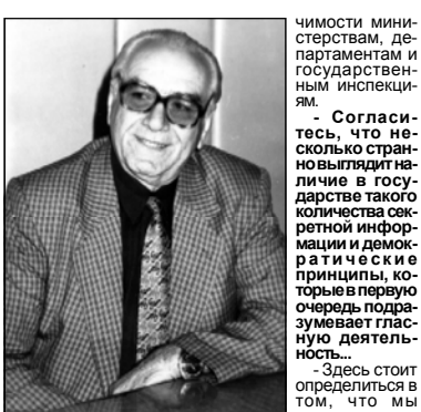
Г. Георгием НА ЧКБЕИЯ

— Исходя из изложенного, можно ли сделать вывод о том, что в основном тайны являются деловыми тайнами властных структур прикрыта от общестственности завесой тайны? — Сводом законов о государственной тайне в соответствии с общедоступным кодексом установлен нормы, точнее правила рассекречивания материалов. Следует отметить, что на базе нашего ведомства выпущен сборник документов, включающий Закон Грузии о государственной тайне, в котором даны правила определения степени секретности информации и их охраны. Помимо этого представлен перечень сведений, отнесенных к государственной тайне. В том числе информация о структуре, положении и работе государственных органов и структур, «охраняющих государственную тайну». В нем помимо условий передачи тайной информации так же представлен список должностных лиц, полномочных обмениваться, хранить и оглашать секретные сведения. Согласно представленным в сборнике инструкциям и происходит засекречивание и обновление секретных данных. Система эта действует во всех исполнительных органах власти. Направленная деятельность представителей нашего ведомства обеспечивать сохранность до указанного времени от разглашения и утери вверенных им подконтрольных организациям ценных бумаг, документов, почты, наград, разработок и многое другое. — Очевидно, уровень