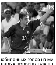
Юбилейных голов на мировых первенствах награды с такими игроками, как Герт Мюллер (ФРГ), Жан-Пьер Пален (Франция), Гари Линекер (Англия) и Клаудио Кандида (Аргентина) значится и фамилия защитника сборной Южной Кореи, передает корреспондент РИА «Новости».

Итальянец Кристиан Вьери забил 1900-й мяч за всю историю финальных турниров на чемпионате мира по футболу.