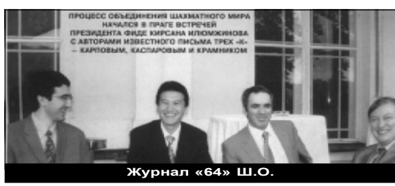
Процесс объединения шахматного мира начался в Праге в ходе встречи президента ФИДЕ Карлоса Илмюнкюна с автором известного письма трех «К» - Карповым, Каспаровым и Крамником.

Мировая шахматная общность с чувством грубого удовлетворения встретила все о примирении шахматиста и президента ФИДЕ Карлоса Илмюнкюна с руководством ФИДЕ. Это историческое событие, которого ждали многие лет.