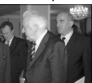
тем, и в этом решении ее поддерживают все европейские структуры", - добавил Эдуард Шеварднадзе.

"После произошедших в мире серьезных изменений сегодня Южный Кавказ рассматривается как составная часть Европы, и поэтому для нас сотрудничество с европейскими странами - жизненно важная задача. Прежде всего имею в виду Бельгию, с которой Грузии связывают многие общие интересы", - обратился к гостю Президент Грузии и наиболее серьезной проблемой страны назвал нерешенные конфликты. "Грузия - сторонник восстановления территориальной целостности только мирным пу-