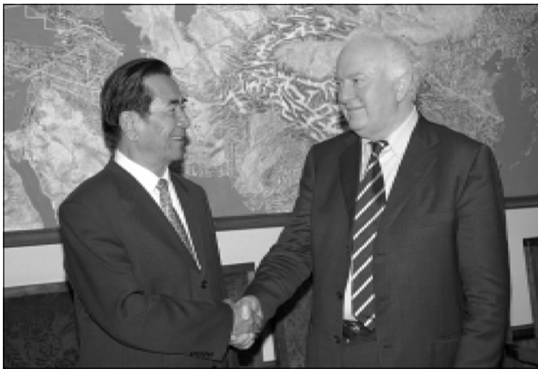
что Китайская Народная Республика как постоянный член Совета Безопасности ООН поддерживает мирное решение конфликта в Абхазии. Следует отметить, что Эдуард Шеварднадзе в ранге главы Грузинского госу-

Эдуард Шеварднадзе выразил благодарность гостю за помощь и заявил, что сотрудничество Китая и Грузии образцовое для других больших и маленьких стран. Глава государства поблагодарил также за содействие в вопросе Абхазии. В частности, известно,