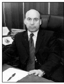
Соломон Павлиашвили, министр управления государством.

Возможности реулирования и влияния на современные экономические отношения среди действующих структур особенно заметны у Министерства управления государством, причем не только в институциональном, но и практическом плане. О том, что достигнуто в этом направлении за последние годы и предстоит обсудить в беседе обозревателя "СГ" с министром управления государством Соломоном ПАВЛИАШВИЛИ.