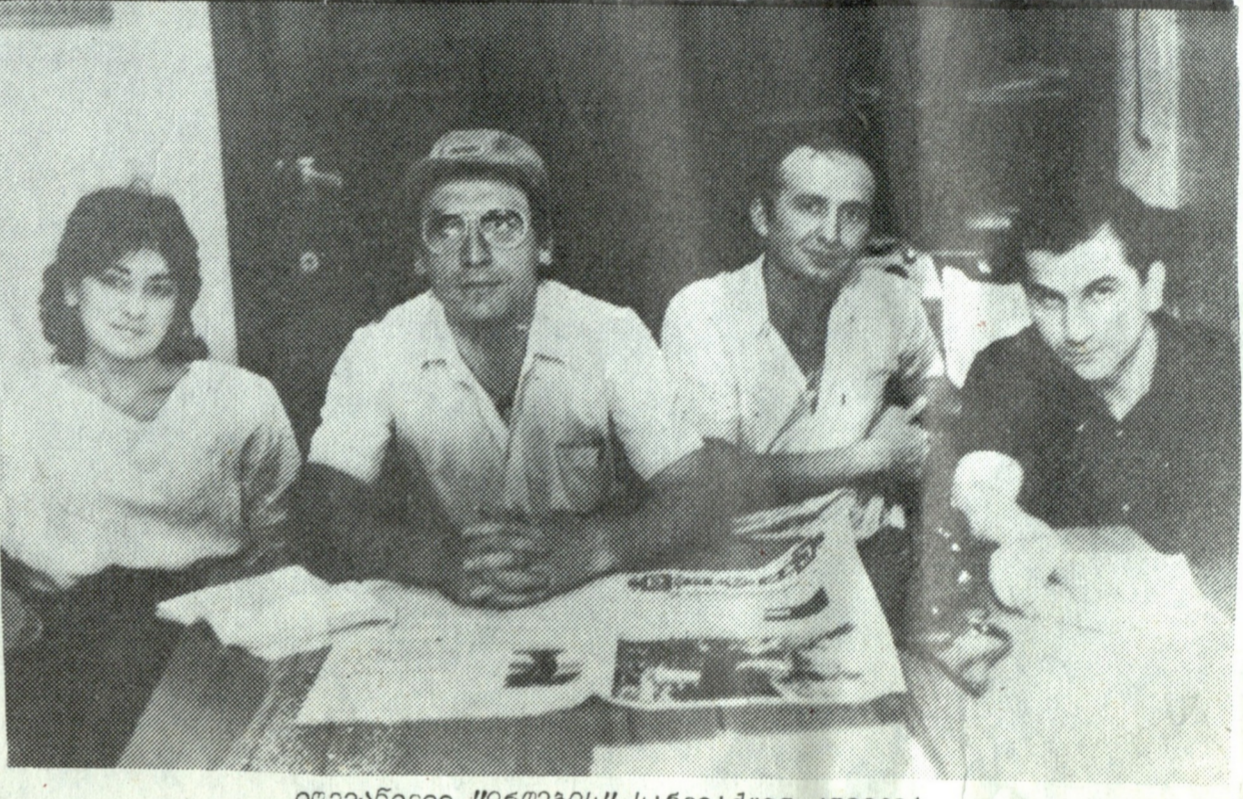
დღევანდელი "დროების" სარედაქციო კოლეგია

ამ დანიშნულებითა და ასეთი მიზანსწრაფვით გაზეთმა ცხრა მთელი წელი იარსება და როგორც უკვე ითქვა 1865 წლის ენკენისთვის 16-ში მეფის რუსეთის ხელისუფალთა მიერ დახურვა. დახურვის მიზეზი გაზეთის ბოლო ნომერში გამოქვეყნებულ მასალაში უნდა ყოფილიყო, მაგრამ ასეთ მიზეზს მასში თითქმის ვერ ვხვდებით. გაზეთის ეს ნომერი არაფრით გამოირჩევიან მისი წინამორბედებისაგან. გამოძინარე აქედან, მი-