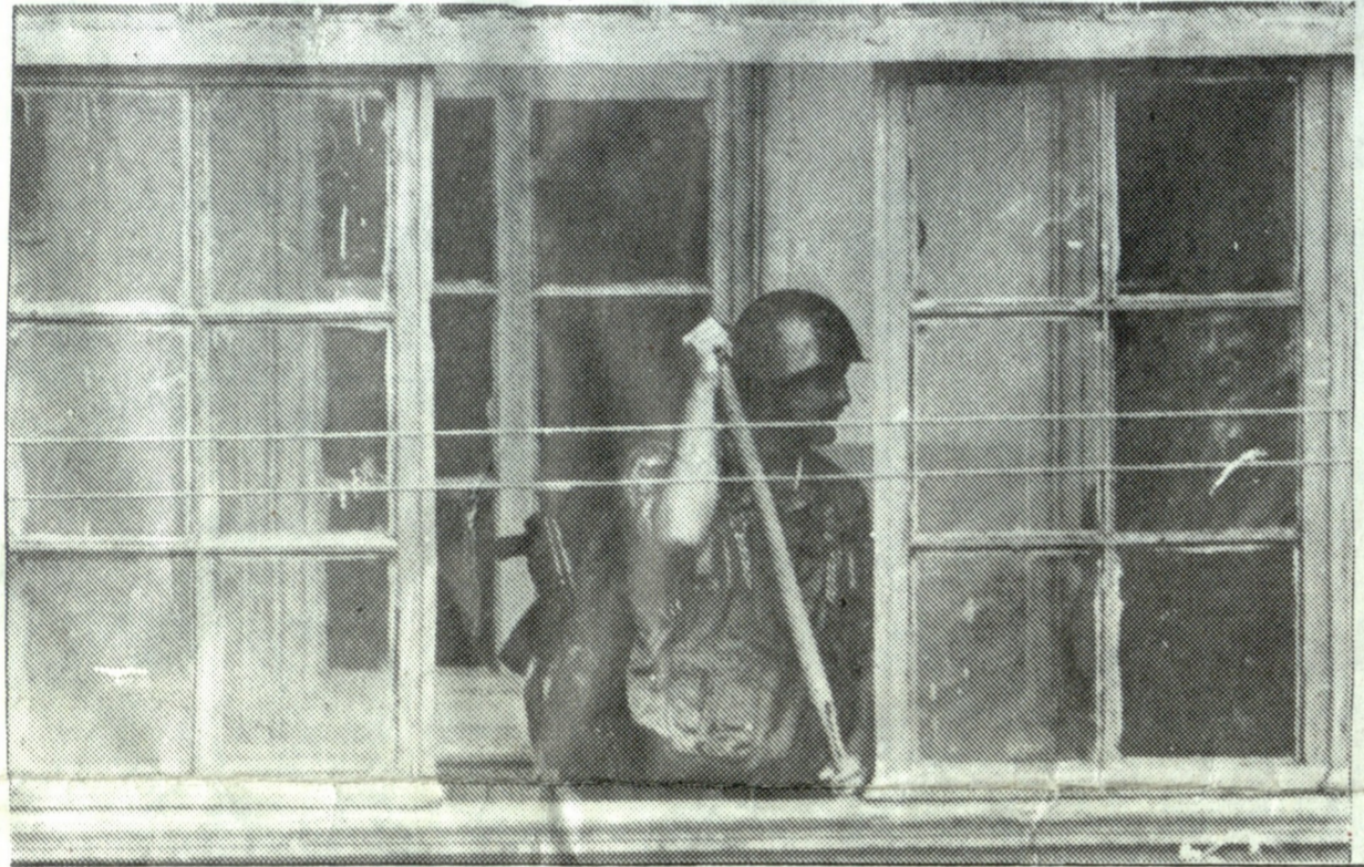
სადკ-ს სამხადერო კომისიის "ხემა-49" 0 5 5 0 8 6 0 0 0

მიმდინარე წლის 19-20 ივლისს თბილისში ოფიცერთა სახლის წინ მიმდინარეობდა საქართველოს ეროვნული დამოუკიდებლობის პარტიის აქცია შენობის ქაღალტის საბოგადოების გადაცემის მოთხოვნით...