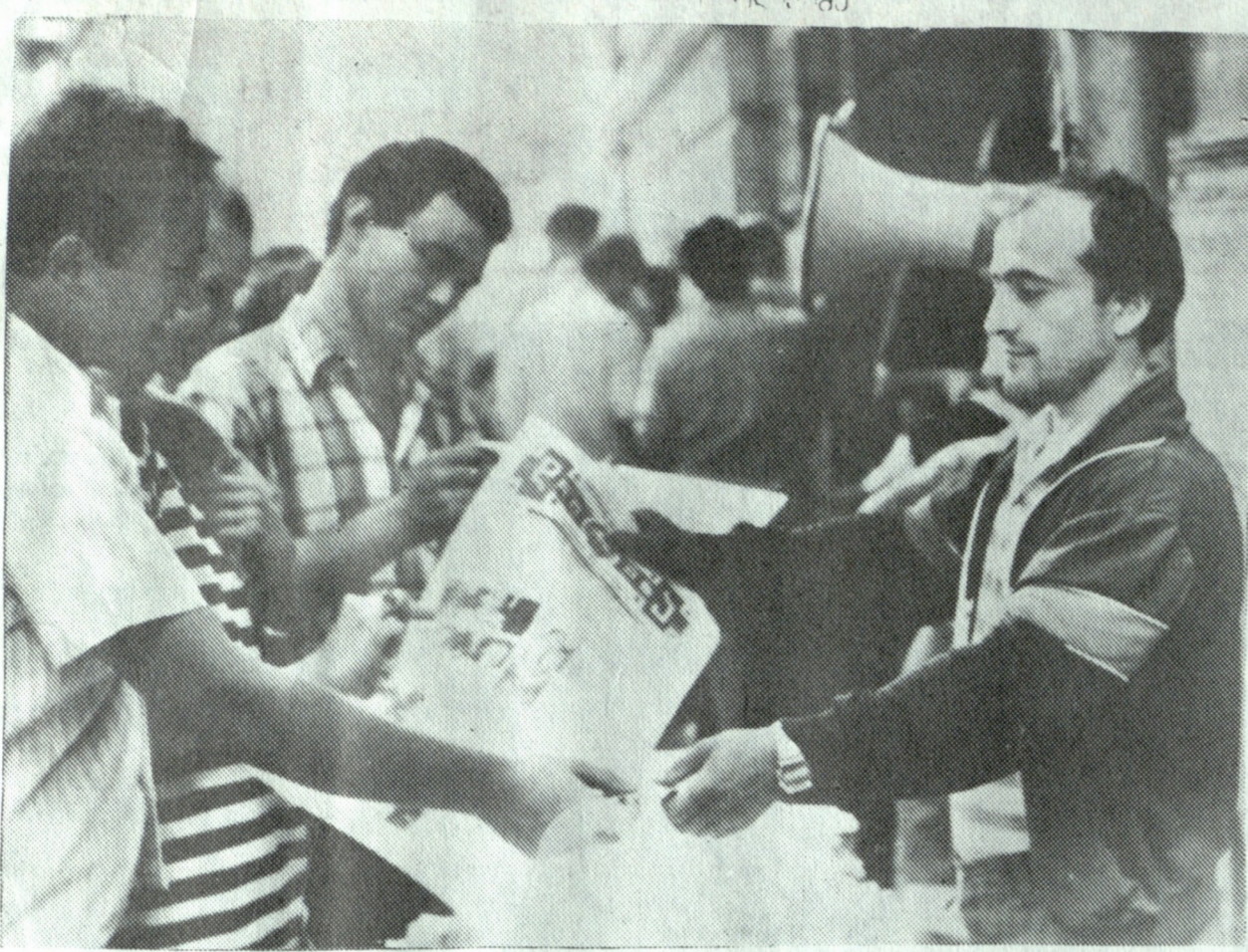
გაზეთ "ღრუბლის" რეალიზაცია თბილისის ქუჩებში.

-სების სფეროსა და უფლებამოსილებას განეკუთვნება, ამიტომ ჩვენ თავს შევიკავებთ საკუთარი საქმიანობის შეფასებისაგან, ხოლო გაზეთის განახლების ერთი წლის მიჯნაზე, ჩვენის შრიც დავძენთ: "ღრუბლა" მოზავალშიც შეეცლება იყოს თბილისური და დინამური და რაც მთავარია, საქართველოს კეთილდღეობისათვის დაუცხრომელი მებრძოლი. საბაბისოდ იგი მაქსიმალურად ააბაღლებს რეკოლეციის ინტელექტუალურ შესაძლებლობებს, მაგრამ ისიც ნუ დაგავიწყდებათ მვირფასო მკითხველებო, რომ, სამწუხაროდ, ყველაფერი ჩვენზე არ არის დამოკიდებული. "ღრუბლას" უჭირს, ისე, როგორც უჭირს ქართველ კაცს, მდლად საქართველოს როგორც უჭირს - სამშობლოს ჩვენსას!