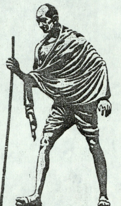
ეროვნული დამოუკიდებლობის ბრძოლის ხალხმწიფე