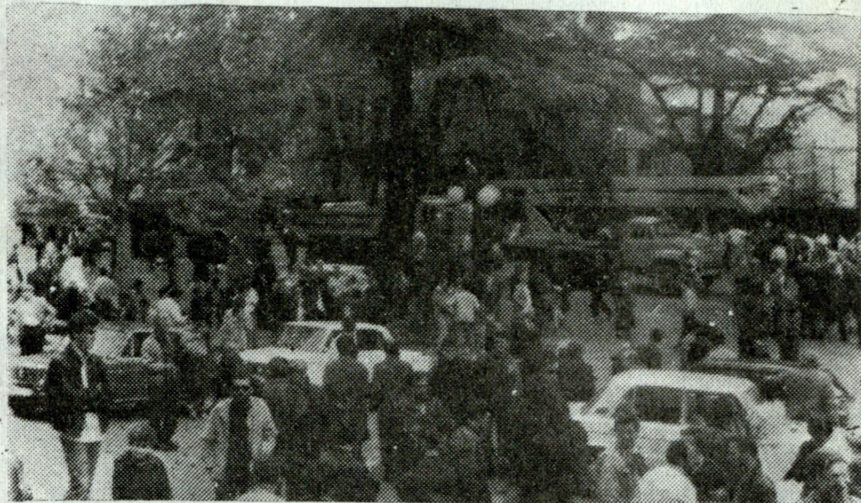
სედამ-ს მიერ მოყვანილი ტექნიკა მზადდა ღვინის ძეგლის ასაღებად