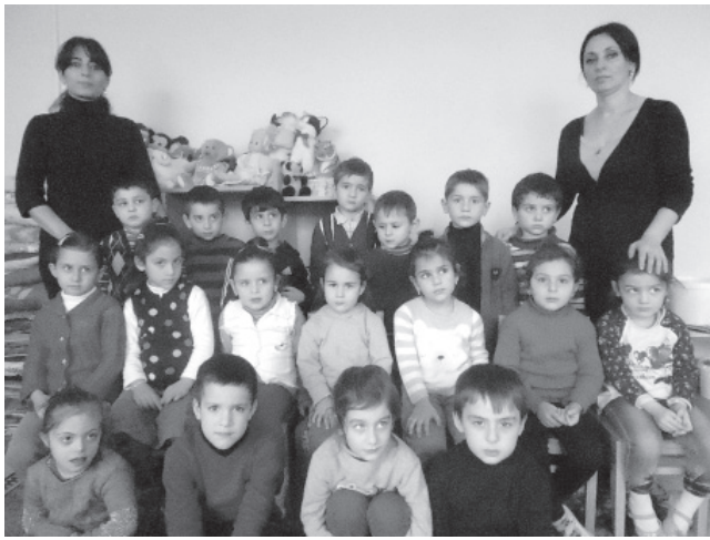
ხელმძღვანელობით გარემონტდა და მოეწყო კიდევ ერთი ახალი ჯგუფი საჭირო ინვენტარითა და სათამაშო კუთხეებით, გასახდელი და მოსასვენებელი ოთახი, სველი წერტი-