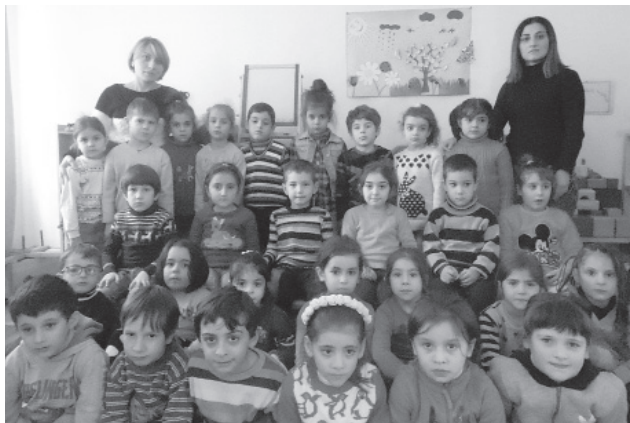
ლი, სამზარეულოს ოთახი. ყოველწლიურად განახლებული გარემოთი ხედებიან აღსაზრდელებს. ყველაფერს დაატყო აკურატული და გემოვნებიანი ხელი. მუხლჩაუხრელი შრო-