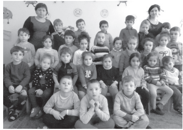
სკოლამდელი აღზრდის დანერგვებზე ყველაზე ლამაზი და სათუთია, აქ ხომ ცეროდენები დედის გარეშე ატარებენ დღეს. ბევრი მათგანი აქ იწყებს ლაპარაკს, სია-