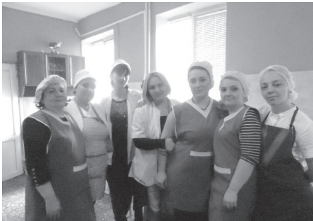
მის შედეგად სახეზეა, ამ წლების მანძილზე 6 ჯგუფიდან 14 ჯგუფამდე გაფართოვდნენ. ყველა ჯგუფი თანამედროვე სტანდარტების დონეზეა მოწყობილი. პატარების აღზრდისა და განვითარებისათვის, მათი გონებრივი და მხატვრული თვალსაწიერის გაფართოებისთვის ყველა პირობაა შექმნილი. უკანასკნელ წლებში, სწავლებისა და განვითარების ახლებური სტანდარტები დაინერგა, აღმზრდელ-პედაგოგ-