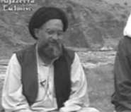
Усама бен Ладен