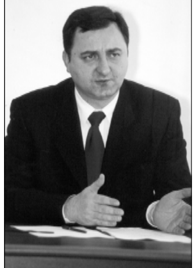
Ладо Чантурия, председатель Верховного суда Грузии

за слабой подготовки кадров. Необходимо введение не только институциональной реформы, но и подготовка самих кадров, профессионалов, которые будут осуществлять эту самую концепцию - как в органах полиции, так и в органах безопасности, прокуратуры, судах. Это тот вопрос, который у нас вызывает.