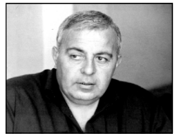
Перевод Михаила ИВАНЧИКИ

скандала не вышло, не обиделись бы родители Самсонника. Старые соседи, нельзя их ругать, да и Розетта ведь цела-невредима, к тому же сама согласилась; бедный Самсоник, как он переживает, наверное!.. Ах, ты моя тебе могилу приготовлю, ты!.. - Делай, что сказано! Хватит и того, что машину угнала, стерва! - Ваню, доколе будешь таким дурнем? Ребенок подрост, чему он от тебя неучится, он ведь все видит? - Ступай, женщина, делом займись, хватит языком трепать, деревня просунулась!