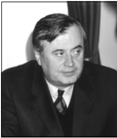
Депутат-мажоритарии от Рача-Лечхуми и Квемо Сванети в Парламенте Грузии обратились к представителям исполнительной власти с просьбой максимально помочь региону с точки зрения развития малого и среднего бизнеса. Поскольку в крае большой потенциал обработки леса, развития

На состоявшемся 5 марта у Государственного министра Автандила Джорбенадзе традиционным региональным совещании представители местных властей Рача-Лечхуми и Квемо Сванети и депутаты этого края в парламенте ознакомили руководителей центральной власти со сложившейся в регионе обстановкой и проблемами.