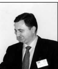
благодарность за содействие и надежду на активную поддержку США в вопросах реформы в органах безопасности и правоохранительных органов. Члены делегации Грузии