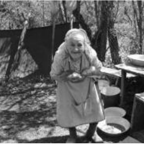
„არც ერთმა შვილმა არ იცოდა, როგორ გაჰქონდა თავი ბებოს, არც ერთ შვილიშვილს არ დაურეკავს და მადლობა არ გადაუხდია გამოგზავნილი ძველისთვის...“