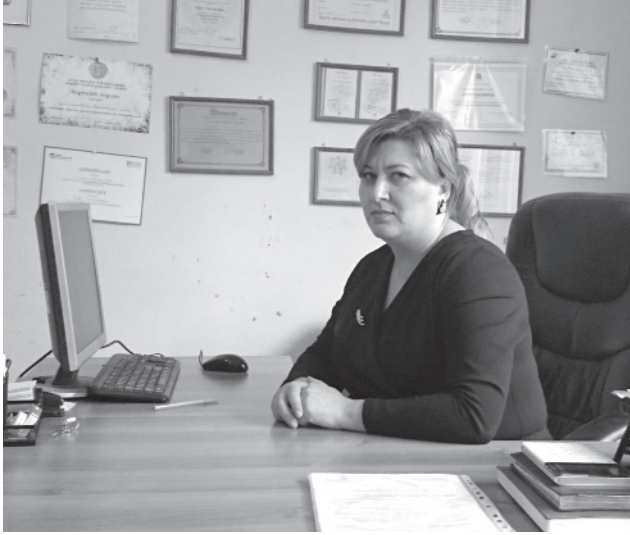
123-ე ბაგა-ბაღი ცეროდენების ზღაპრული სამყაროა. იგი, გლდანის მე-7 მიკრო-რაიონში მდებარეობს და დედაქალაქში ერთ-ერთი სანიმუშოა. - არაჩვეულებრივი წესრიგი, სისუფთავე, კომფორტი და რაც მთავარია, მომავალ თაობაზე

ლებით ვზრუნავთ პატარებზე. ჩვენი მიზანია, პატარებს სიყვარული და მზრუნველობა არ მოვაკლოთ და აქ თავი კარგად იგრძნონ. ბაღში ბავშვთა რაოდენობა ორჯერ გაიზარდა, სულ 14 ჯგუფია. ჩვენს აღსაზრდელებს ზეიმებს, ძირითადად, ეზოში და ღია სივრცეში ვუწყობთ, რადგან იქ უფრო თავისუფლად და ლაღად გრძნობენ თავს. ამ პროცესში უფროსებიც ვართ ჩართულნი. ჩვენთან ყოველი ღონისძიება ფოიერვერკით და ცაში ბუშტების გაშვებით სრულდება, რაც პატარებს ძალიან მოსწონთ.