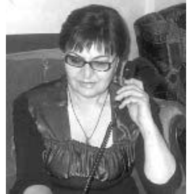
მიეწოდება ინფორმაცია მისი ადვოკატის მეთაურობის შესახებ;

ტელ.: 2 79 63 91; 0 790 60 64 69; 5 93 78 64 69