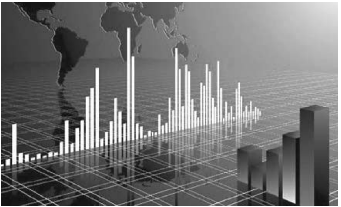
ლია, ინვესტორებს საკუთარი მუშახელი მოჰყავთ და ქვეყნიდან დოლარი გააქვთ. აგერ, ჩინეთმა ლამის, სახელმწიფოში სახელმწიფო შეგვიქმნა.

მდგომარეობას ასახავს, სადაც ბანკების კლიენტურის ჩართულობაცაა. დღეს, ბანკების კლიენტურა ვერ ერთვება იმიტომ, რომ საერთოდ არ იციან ბანკი და გარიგებას დადებს, როგორ და ა.შ. „ეროვნულმა ბანკმა“ ამას თუ არ მიხედა, მომავალში მიზნობრივად, რაციონალურად და ეფექტიანად ინტერვენციების განხორციელება, ძალიან გაუჭირდება. ჩვენ მცირე ეკონომიკა გვაქვს. თუ ასე გაგრძელდა, ღირს ძალიან ცუდად დაამთავრებს არსებობას — ვერც „ეროვნული ბანკის“ ინტერვენციები უშველის და ვერც მთავრობის დაპირებები. ეს საკითხი სასწრაფოდ მისახედია. იმედია საღადაწვევტილებას მიიღებენ და ოპტიმალურს გახდიან როგორც ბიუჯეტის ხარჯვას, ასევე, ბიუჯეტის დეფიციტის დაფინანსების ხერხებსაც გადახედვენ. მოლოდინი არის შიში — ხვალ რა მოხდება. ამას დომინოს ეფექტს ეძახიან. წინაპი-