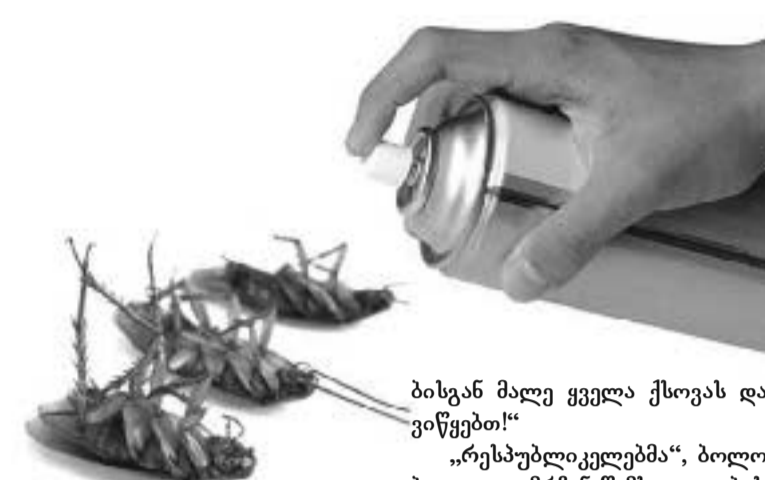
ბისგან მალე ყველა ქსოვას დაიწყებთ!

„რესპუბლიკელებმა“, ბოლო-ბოლო დამრჩენ-წამსვლელებისა დალიეს და ჩაყურდნენ?“