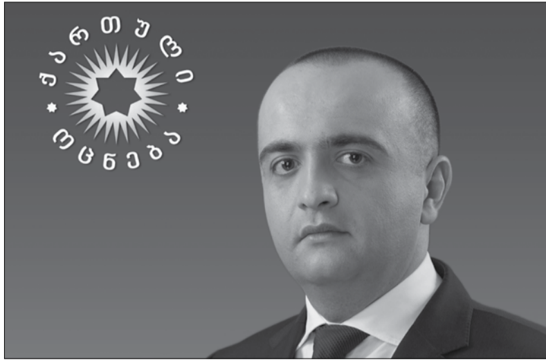
საქართველოს პარლამენტში. ზესტაფონი გახდება უფრო საინტერესო და მიმზიდველი მცირე და საშუალო ბიზნესისთვის; პერსპექტიული ადგილი ახალ-

მომავალი 4 წლის მანძილზე, მე ვიქნები თითოეული ზესტაფონელის ოჯახის ქომაგი და ინტერესების დამცველი