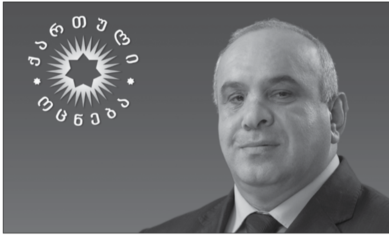
ამ გზით ვაგრძელებთ სვლას დღესაც. ჩემო ძვირფასებო, ბაღდათელებო,

რებდა და მოქმედების სფეროს იფართოებდა ეროვნული მოძრაობა, ბაღდათლებთან, ზესტაფონელებთან, ხარაგაულელებსა და სხვა კუთხის მამულიწვილებთან ერთად, გვეთქმის იმ გზას, რომელზეც საქართველოს ბედნიერებამ გაიარა. თავდაუზოგავი, მიზანმიმართული ბრძოლით მოვიპოვეთ თავისუფლება, მაგრამ, როცა კვლავ შეგვექმნა ბარიერები და საჭირო გახდა წარმომადგენელი თავისუფლების დამტყუანება, ბატონი ბიძინა ივანიშვილი წაგვიდგა წინ და ხალხის ერთსულოვანი მხარდაჭერით, ისევე საიმედოდ ჩავჭიდეთ ხელი თავისუფლების დროშას.