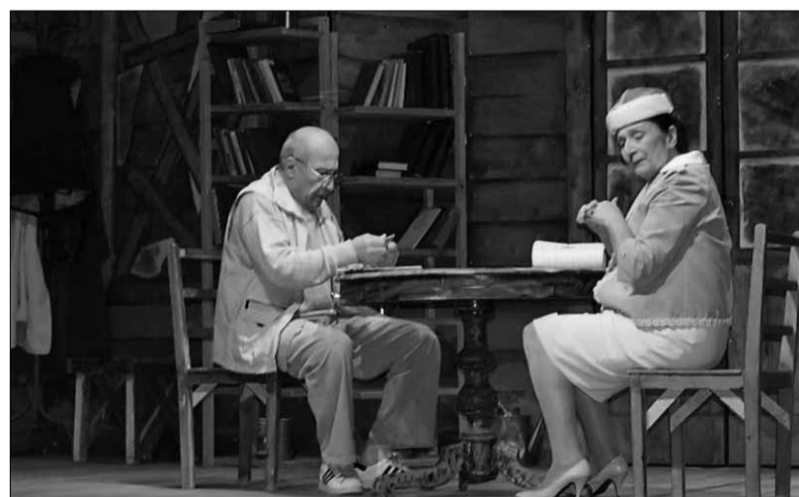
სანა საამაძაქლიდან „ჯინი“

შესაფარში და ის მთლიანად აგებულია ორი ადამიანის ურთიერთობაზე, რომლებიც ძალიან მძიმე ფსიქოსოციალურ გარემოში ცხოვრობენ. მათ უყვარდებათ ერთმანეთი, თუმცა არ ყოფიან