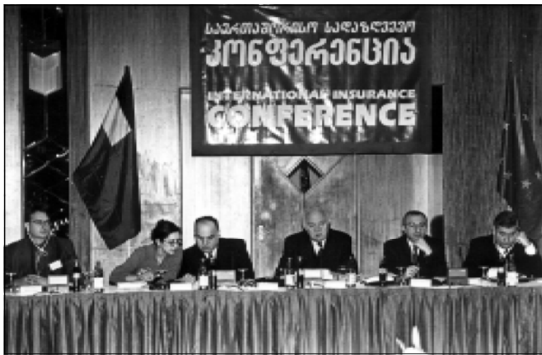
საერთაშორისო ასტრანსურანსის კონფერენცია INTERNATIONAL INSURANCE CONFERENCE