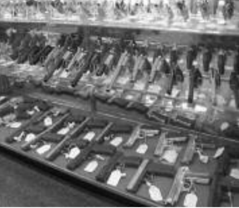
„ისეთი განცდა მაქვს, რომ ირგვლივ ყველა უბანში სამოეები და განგსტერული დაჯგუფებებია შექმნილი, რომლებსაც არაფრის ეშინიათ“

ბოლო ხანს ღამის თვე არ გადის, რომ ქვეყანაში ცეცხლსასროლი იარაღით ჩადენილი დანაშაულის შესახებ არ გავრცელდეს ინფორმაცია. ამ ცოტა ხნის წინ, ქალაქის ცენტრალურ უბანში მომხდარმა მკვლელობამ, როდესაც დღის საათებში, ხალხმრავალ ქუჩაზე მიმავალ ავტომობილს თავს დაესხა ერთი პირი, ერთი ადამიანი მოკლა, მეორე კი დაჭრა, ჩვენი საზოგადოება გვარაიანად შოაშოთა.