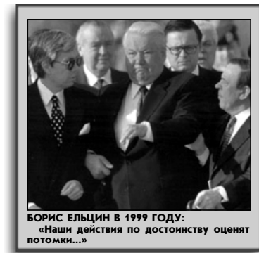
БОРИС ЕЛЬЦИН В 1999 ГОДУ: «Наши действия по достоинству оценят потомки...»