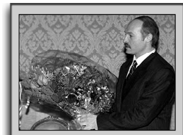
АЛЕКСАНДР ЛУКАШЕНКО В 1993 ГОДУ: «Если бы у нас была другая возможность, то на хрена нам нужна была бы эта Россия с ее бардаком!..»