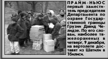
ПРАЙМ-Ньюс заместитель председателя Департамента по охране Государственной границы Грузии Давид Чхидидзе. По его словам, наиболее тяжелораненых в четверг, 9 декабря, на вертолете доставят из Шатили в Тбилиси.

На чеченском участке грузино-российской границы в районе селения Шатили в настоящее время находятся около 300 чеченских беженцев, среди них до десяти раненых, сообщил агентству