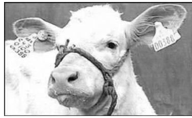
Европейская комиссия приняла решение прибегнуть к судебным мерам

против Франции, отказывающейся снять эмбарго на импорт британского говядины. Председатель Европейской комиссии по продовольственной безопасности заявил, что эти меры не повлияют на текущие переговоры между Францией и Великобританией, выразив надежду, что эмбарго будет снято в ближайшие дни.