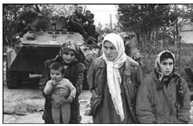
Чтобы ограничить масштабы военной кампании в Чечне, Верховный комиссар ООН по делам беженцев Саадо Огата про-

водит в Москве переговоры с руководством российского правительства. Цель переговоров - облегчение судьбы бежавших из зоны