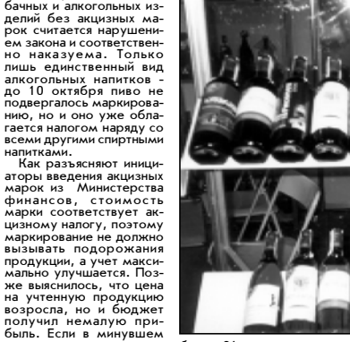
Более 91 миллиона лари поступило в бюджет от реализации акционных марок на сигареты.

В августе за счет отчисления транснациональных компаний и производителей сигарет резко ограничили реализацию марок и, соответственно, поступление налогов. По словам заместителя министра финансов Гелы Ханнишвили, эта ситуация вызвала недовольство международных организаций.