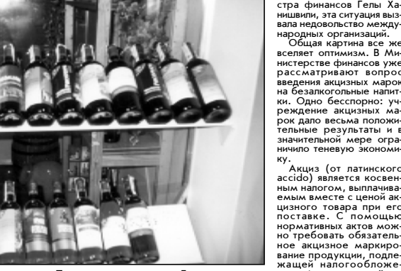
В виде акционных налогов за год в бюджет должно поступить 147 миллионов лари.