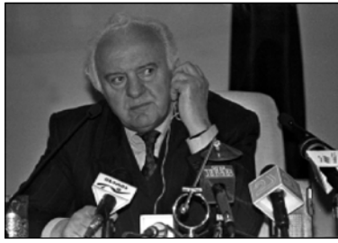
18 октября Президент Грузии Эдуард Шеварднадзе провел брифинг и ответил на вопросы журналистов.

— Что Вы переживали в минуты, когда в Германии вручили Вам высокую награду? — Я был горд, что являюсь сыном своей страны. Эта награда означала высокую оценку Грузии на Западе, в частности, в Германии. Я думаю в эти минуты о нашей стране с ее большими традициями и огромным будущим. — Начальник Генерального штаба Вооруженных Сил Грузии Джони Пирхалашивили заявил, что в последние