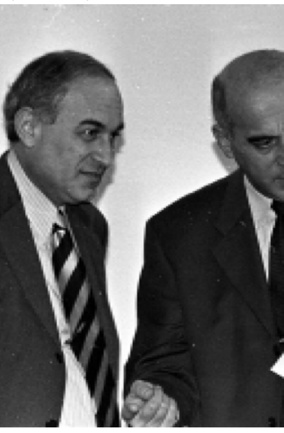
Эдуард Шеварднадзе, Президент Грузии.

роре можно использовать для ведения огородов, поскольку восторно восторго строительств небольшие туристических баз. Вместе с тем глава государства поручил рабочей группе, которая будет создана, серьезно проработать над внесением изменений в Налоговый кодекс. Пока мы лишь только обдумываем избирательный сделать это, сказал он, а надо уже сейчас предметно заняться в данном вопросе, уже до выборов парламенту следует иметь приближенно перечень тех проблем и в вопросе, над которыми предстоит поработать, чтобы бы президентских выборов Налоговый кодекс получил бы, в которую войдет, что будет приемлемо для страны. Как заявил Эдуард Шеварднадзе, не обязательно сделать во всех случаях, независимо от того, какая политическая сила победит на выборах, этот вопрос должен найти отражение в программе каждой партии, каждого кандидата в депутаты.