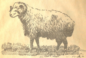
სურ. 1. თუშური ცხვარ.

ნაწარმოებების საწყობები. ყოველივე ეს დიდ დახმარებას უწევს მათ ნაწარმოების მოგროვებაში და გასაღებაში. ჩვენშიაც არის მეცხვარეთა ამხანაგობა „მწყემსი“ და სხვა მეცხვარეთა კავშირები, რომლებიც დიდ დახმარებას უწევენ მეცხვარეებს, მაკალ. თუშურ მატყლზე სამართლიანი ფასების დაწესებაში, საძოვრების საკითხის მოწესრიგებაში და სხვა. შეამხანაგებას და შეკავშირებას ყველგან დიდი სარგებლობა მოაქვს. ამიტომ საჭიროა ყველა წვრილი მეცხვარე შეკავშირდეს და შეამხანაგდეს, რომ შეერთებულის ძალით უფრო კაოვად და სარგებლიანად აწარმოონ მეცხვარეობა.