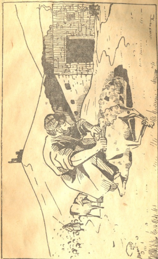
სუ . 2. სვების კრეკა.

ატყლს და ყვილსაც მეთს მოგვეცემს, უფრო აღვილად გადიტანს შო- რეული საზაფხულო საძოვრებზე გადარეკვას და უფრო ნაკლებადაც დავარდება.