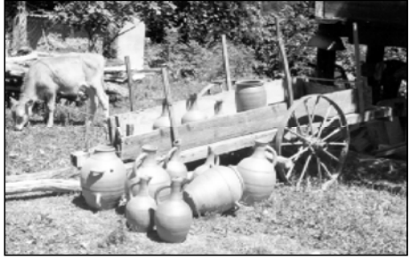
Делая изделия из керамики

можно сделать весьма интересные выводы: керамика попала в руки людей, которые не хотели забываются о развитии этого вида искусства, сколько о собственных доходах. И если такое отношение к искусству шрошинцев будет продолжаться, мы утратим его навсегда. - Я вполне согласен с мнением коллеги, - говорит нам профессор Академии художеств Грузии Рома Цухишвили. - Лишь в Шроша создают керамические изделия с фамильной маркой. Но сегодня шрошинские мастера нуждаются в заботе и внимании. Тяжелое экономическое положение в стране, несовершенство системы взимания налогов вынудили многих оставить это ремесло, заняться более доходным делом, позволить прокормить семью. Гонимый же труд, хотя, молодежь уходит в город на заработки, забы-