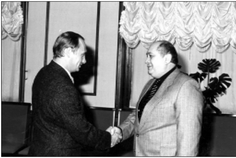
Встреча бывших коллег, двух председателей спецслужб государств СНГ - по безопасности и разведке Март, 1999 г.