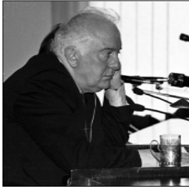
Начавшегося сегодня визита правительственной делегации Грузии в Москву.

- Вы уже отмечали, что вопрос российских баз в Грузии является предметом грузино-российских переговоров... Когда они могут состояться? Будут ли эти вопросы обсуждаться в ходе