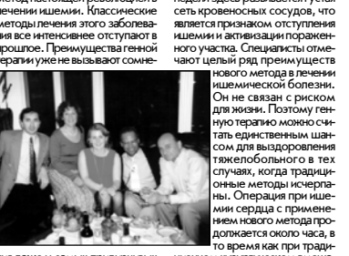
Специалист по генной терапии