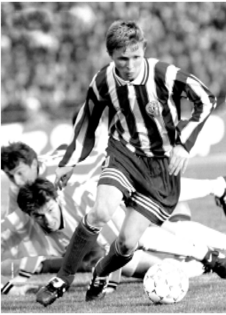
(МКК), который оспаривают сильнейшие клубы двух ведущих футбольных континентов - обладатели Кубка европейских чемпионов (КЕЧ) и Кубка Либертадорес. Год рождения МКК - 1960. С 1980 года инициативу проведения этого суперфинального матча взяли в свои руки японцы, точнее, фирма "Тойота" - генеральный

Таким образом, чаще других - 19 раз - Кубком Либертадорес владеют аргентинские команды. 11 раз он достался бразильцам, 8 - уругвайцам, дважды - парагвайцам и по разу - чилийцам и колумбийцам. Любопытно, что лучший из аргентинских клубов - "Индепендьенте" - владел призом семь раз, причем четыре года подряд (1971-1974) не уступал его никому. Но если лидеру аргентинского футбола удалось завоевать титул лучшего клуба Южной Америки 11 раз, то ни одной из популярных бразильских команд не удалось сделать это более двух раз, причем знаменитый "Сантос" последний свой успех праздновал в 1963 году. Правда, справедливости ради следует отметить, что финалы последних лет проходят под знаком превосходства бразильцев: из восьми турниров (1992-1999) они выиграли пять! Есть еще один турнир, который по своим основаниям можно назвать вершиной кубковых соревнований для клубных команд. Об этом, кстати, свидетельствует и само название - "Межконтинентальный кубок"