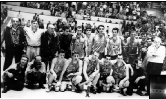
Завершился девятидневный баскетбольный марафон, и опять (уже в седьмой раз подряд) чемпионом Грузии стал