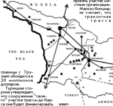
границы с Грузией обойдется в 30 миллионов долларов. Турецкая сторона утверждает, что сооружение "своего" участка трассы до Карса она будет финансировать за счет собственных источников. Грузинская и азербайджанская стороны обсуждали вопрос обращения к международным финансовым организациям. Однако

Окончание Общая протяженность линии электропередачи на территории Грузии составляет более 250 км. Из Азербайджана она дойдет до ТбилиГЭС, затем - до Ахалхиде, где будет построена подстанция (400-500 вольт), и, наконец, турецкий город Карс. Ее сооружение, предполагается, займет 2 года. Стоимость сооружения грузинского участка, по подсчетам турецких экспертов, составит 120 миллионов долларов. Однако грузинские специалисты считают, что затраты не превысят 92 миллионов долларов. Принято во внимание, что в Грузии на этом участке уже был осуществлен определенный объем строительства, а также наработана проектная документация. Грузия заинтересована в возможном сокращении затрат, что авторитетски подтверждает к уменьшению времени выкупа энергогидростанции. "Саживаеда турменский" имеет репутацию организации, способной качественно и оперативно решать подобные задачи. Между прочим, "легендарный" 9-й блок есть и в Азербайджане, однако, в отличие от грузинского, он вообще проставлен. Считается, что его восстановление, а также строительство передающей линии до