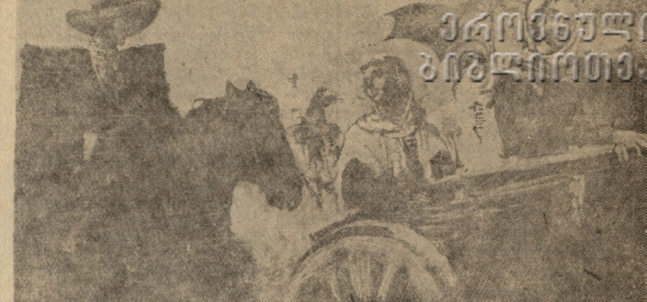
რაკა, სურათი მხატვარ ი. გუგუნიძისა.