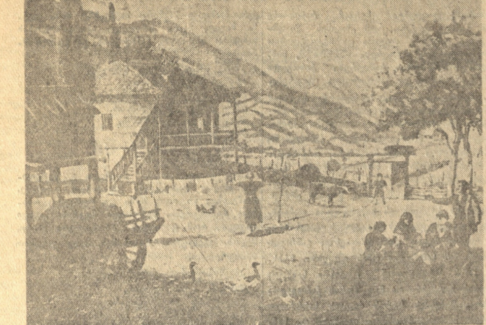
მეხანეთი, სურათი მხატვარ ი. გუგუნიძისა.