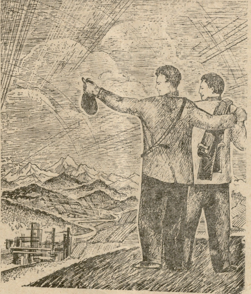
ილუსტრაცია ს. კეცხოველისა

—მაგრამ ეს ერთის წუთით. შემდეგ კი უკმაყოფილება შემფოთებამ შეცვალა.