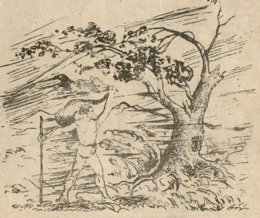
ილუსტრაციები ს. კეცხოველისა

საბჭოთა ხელისუფლება მოკლის თქვენი ოსტატების ბაბილულ ჩაფხრომას „ქველაში მნიშვნელოვანი“ (ლენინი) და ქველაში მასოგარივი ხელოვნების—კინოს—ახალ სფეროებში.