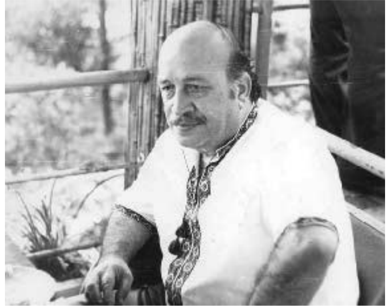
ცა სანოტე რეუულია, ვინ ინატრა სხვა ჭერი, — შენი ამღერებულა მთელი იმერ-აშერი!