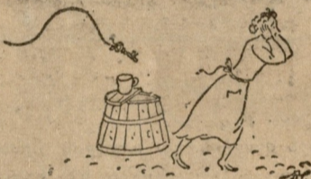
ბ. ტიმოფევის ილუსტრაციები

„ზღაპარს იშვიათი შესაძლებლობანი მოეპოვება; იგი ერთის დაკვირვებით ხელთ