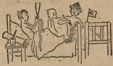
ბ. ტიმოფევის ილუსტრაციები

დიდი პასუხისმგებლობა აწევს საბავშვო წიგნის ავტორს, როდესაც იგი ისეთ სერიოზულ მოვლენებს ასახავს, როგორცაა ადამიანის სიცოცხლე, ტანჯვა და სიკვდილი. მათი უფულოდ და ზერელედ მოცემა ყოვლად დაუშვებელია.