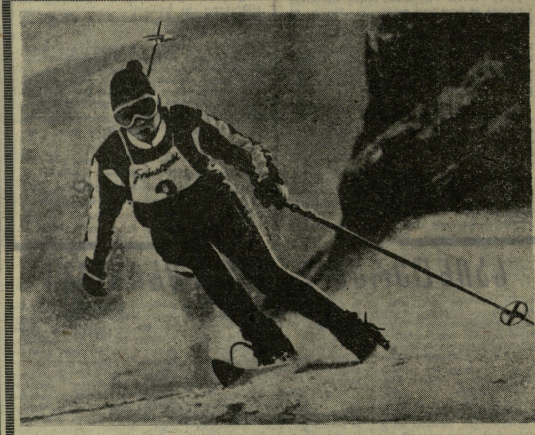
სუარსი გიგად დაშავდა. სუარსი გიგად დაშავდა. სუარსი გიგად დაშავდა.

ინგლისის ჩემპიონატის XXVI ტურში ვერც ერთმა ლიდერმა ვერ შეძლო ქულათა მაქსიმუმის მოპოვება. მადლითა, „ლივერპულმა“, რომელიც უკვე კარგა ხანია I ადგილზეა, ფრედ ითამაშა საკუთარ მიწოდებულ ვესტ ბრომვიჩ ალბიონთან. მასინბლემბა დასაწყისში გაუშვეს 2 გოლი, მაგრამ შესვენებამდევე გაქოტეს ორივე გოლი - 2:2. II ადგილზე მყოფი „ბერლი“ დამარცხდა „შეფილდ იუნაიტედთან“ (1:2), ხოლო „ლიდს იუნაიტედმა“ ფრედ ითამაშა „სტოკ-სიტისთან“ - 2:2.