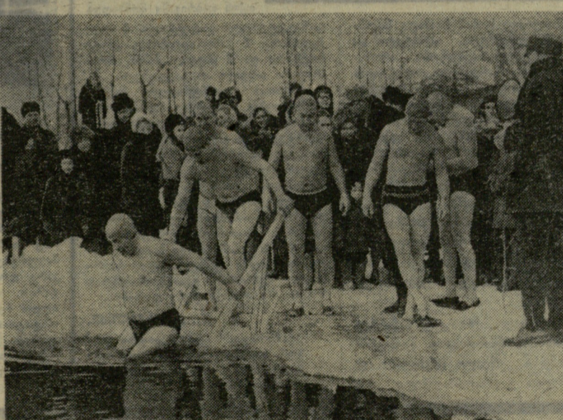
სურათზე: ბანაობა სესტრორეცის კულტურისა და დასვენების პარკ „ლუბიში“.