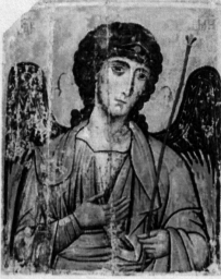
წმიდა მთავარანგელოზი გაბრიელი

ერთ კი შთბლიურ ფუძისან ჩვენი ანგელოზის წესით და სულიერო წყობით შეიქმნა კი ფუძის ანგელოზის ძახილს? ყოველი ჩვენი უნდა დაუბრუნდეს შთბლიურ საყვირებს, ამბის ხანას, კერძის - თაყის ფუძეს. ეს დაბრუნება სულიერო შთბლიურ საყვირებსა და სულიერო შთბლიურ საყვირებს.