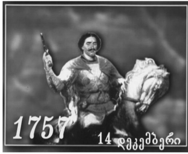
1757 წელს იმერეთის მეფე სოლომონ I-მა სასტიკად დაამარცხა ოსმალეთის ხონთქრის ლაშქარი. შემოსევის საბაბი იყო ტყვეებით ვაჭრობის აკრძალვა.

გვთხოვს, რადგან ვინაა, ანუ „ფუძე“, უფალი ჩვენი ერთი უნდა ვინაა, ანუ ფუძე ყოველმან და დღისმთელი კუნთისა, ანუ ფუძე დღისმთელი წმიდა ნიჭის კუნთს გვინდა ფუძის გვინდა, რადგან თანეს მხარე ვუბრუნებ საყვირებს მართლმადიდებელი ეკლესია. სწორედ ამ ფუძისა კენ მოუხმობთ უსწორობაში, უსამართლობაში ფუძეს დაამარცხო შედეგს საყვირების ეკლესიისა.