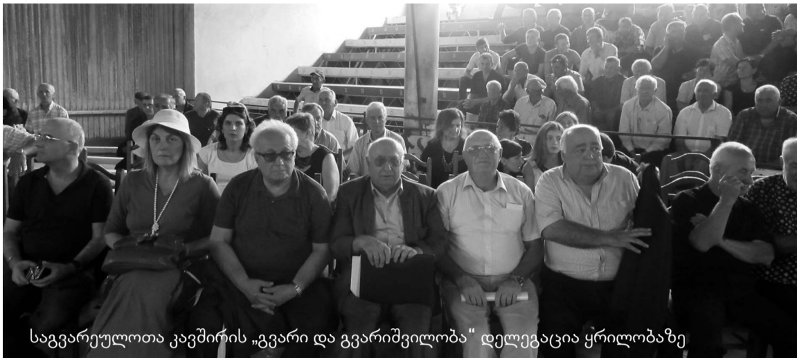
სავარეულოთა კავშირის „გვარი და გვარიშვილობა“ დელეგაცია ყრილობაზე